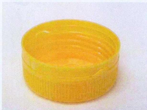
Vz. č. 66138