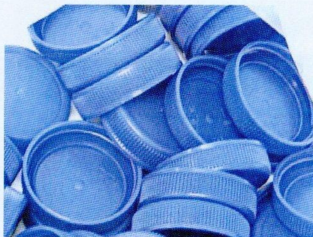
Vz. č. 66139